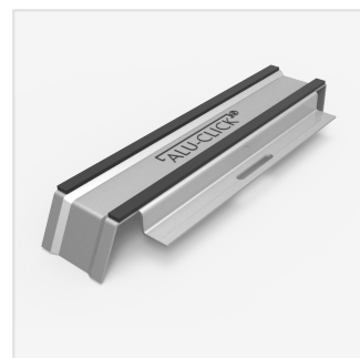
ALU-CLICK®-Platte Gerillte Platte mit Bitumendichtung