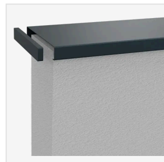
Endkappe Kappe zum Abschließen des Endstücks