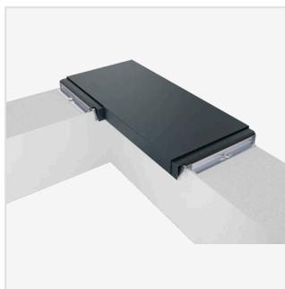
90°-Außen-/Innenecke Sonderstück für Mauerecken