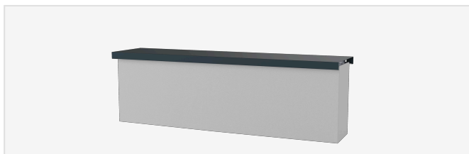
Aluminiumprofil & ALU-CLICK®-Platte 3 m lackiertes Profil + gerillte Platte mit integrierter Bitumendichtung